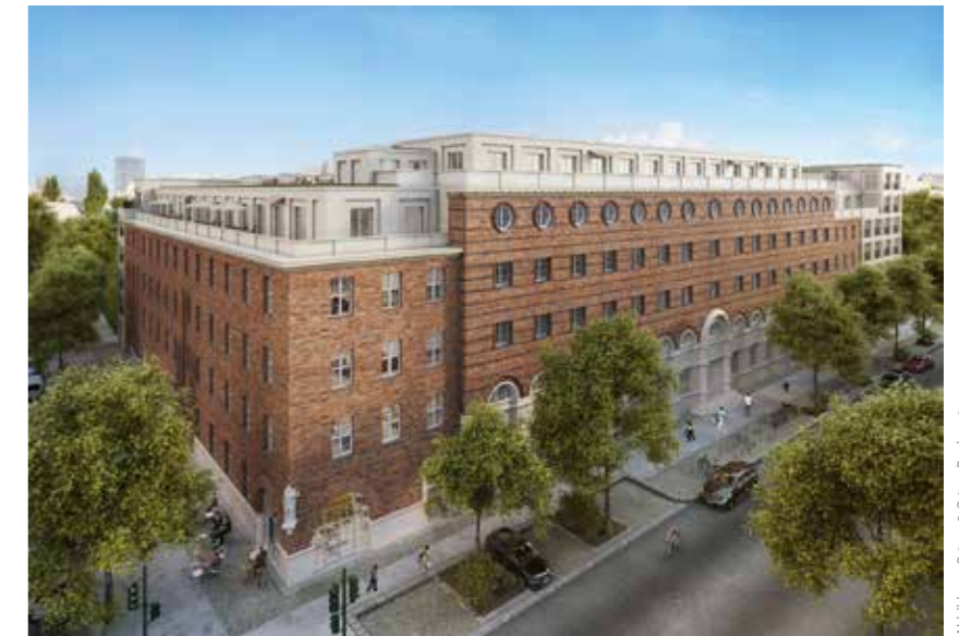
Abbildung: Ormer & Ormer Baukunst

der Erholung, die privaten Gärten, die Durchgänge sowie die Balkone und Dachterrassen. Die Außenanlagen haben die Funktion eines Ausgleichs in der dichten Bebauung und dienen als qualitätsvolle Erweiterung des Wohnraums. Neben den hochwertigen öffentlichen Räumen wird privater Freiraum zur Verfügung gestellt. Zehn private Gärten im Erdgeschoss, Dachgärten und Dachterrassen werden angeboten. Damit erhalten die Wohnungen Balkon und Garten.